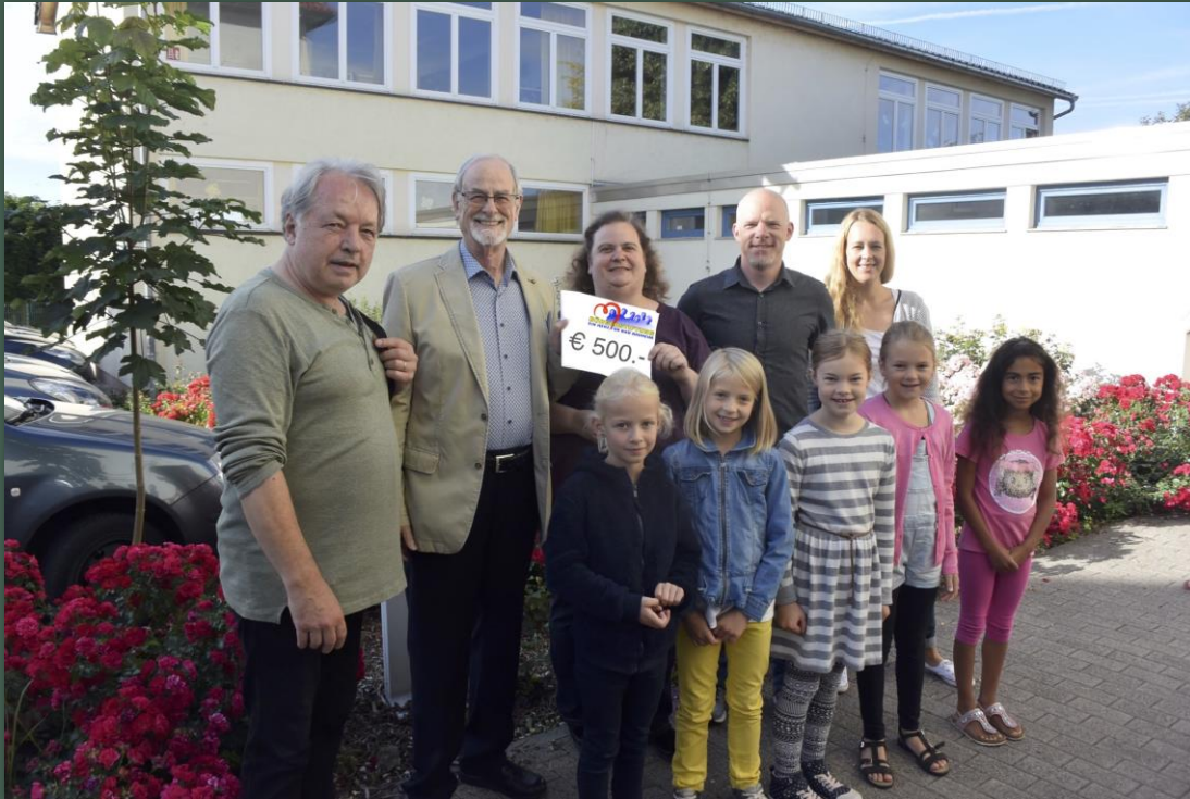
Förderverein Rosendorfschule Steinfurth e.V.