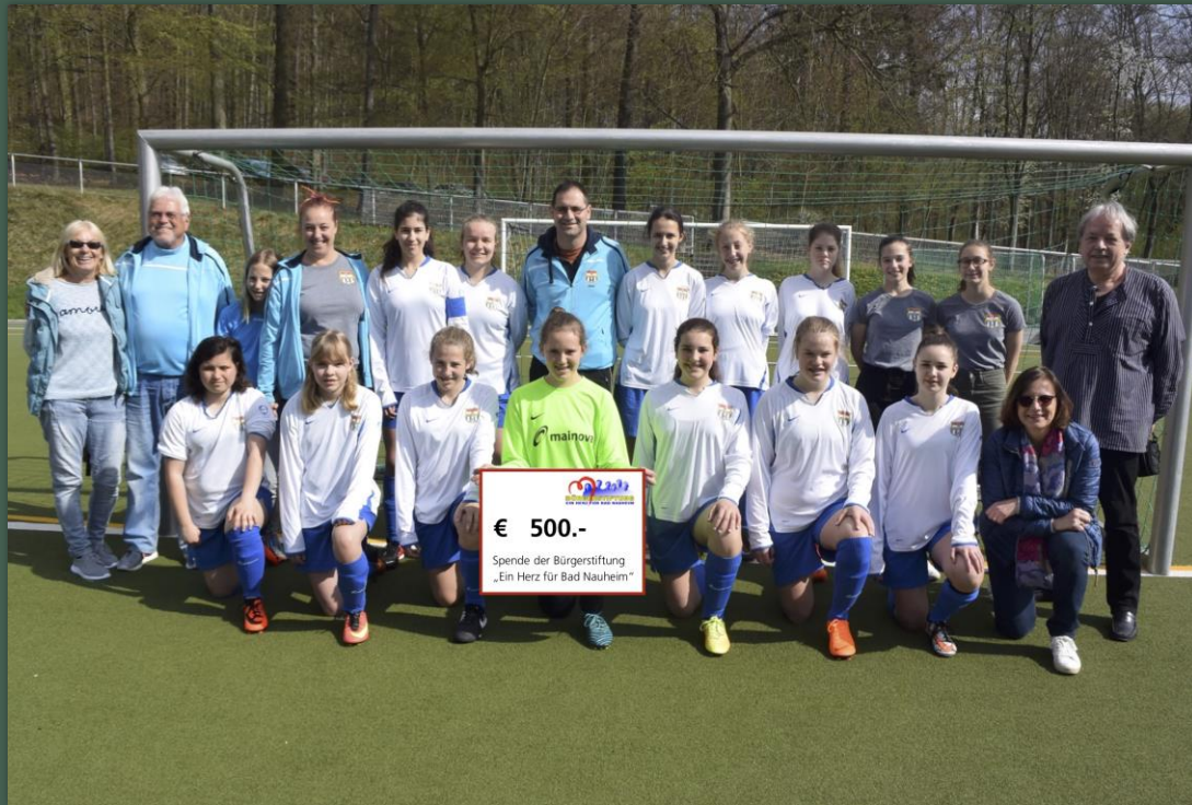
SV 08 Bad Nauheim e.V. Mädchenfußballmannschaft