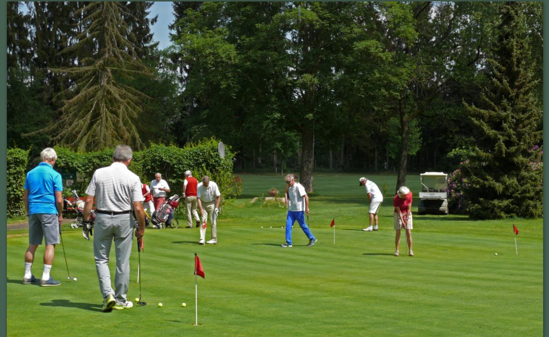
Golfturnier mit Preis der Bürgerstiftung